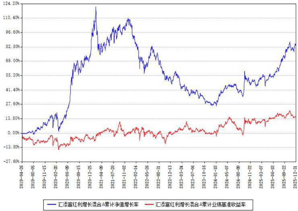
汇添富红利增长混合A累计净值增长率与同期业绩基准收益率对比图