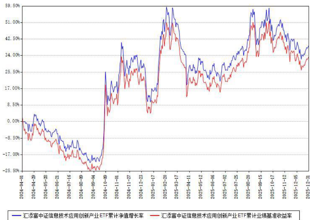
汇添富中证信息技术应用创新产业ETF累计净值增长率与同期业绩基准收益率对比图

注：本基金建仓期为本《基金合同》生效之日（2024年04月01日）起6个月，建仓期结束时各项资产配置比例符合合同约定。