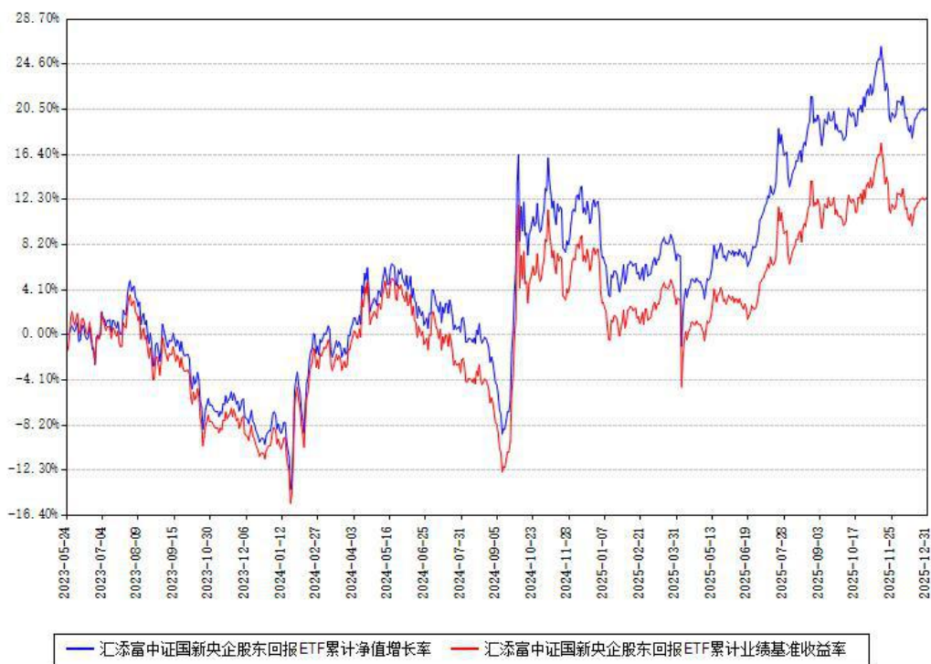
汇添富中证国新央企股东回报ETF累计净值增长率与同期业绩比较基准收益率对比图

注：本基金建仓期为本《基金合同》生效之日（2023年05月24日）起6个月，建仓期结束时各项资产配置比例符合合同约定。