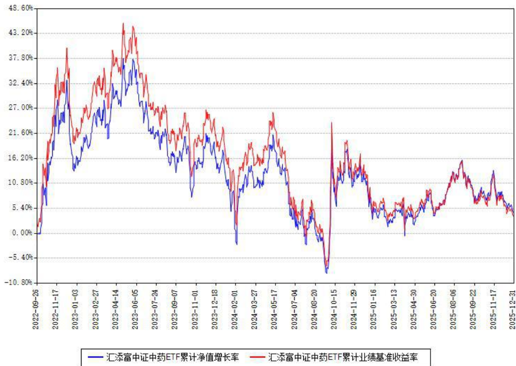
汇添富中证中药ETF累计净值增长率与同期业绩基准收益率对比图

注：本基金建仓期为本《基金合同》生效之日（2022年09月26日）起6个月，建仓期结束时各项资产配置比例符合合同约定。