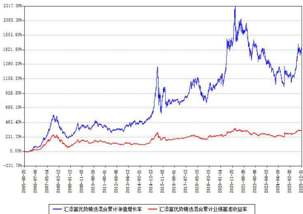
汇添富优势精选混合累计净值增长率与同期业绩比较基准收益率对比图

注：本基金建仓期为本《基金合同》生效之日（2005年08月25日）起6个月，建仓期结束时各项资产配置比例符合合同约定。