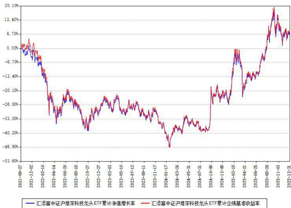
汇添富中证沪港深科技龙头ETF累计净值增长率与同期业绩基准收益率对比图

注：本基金建仓期为本《基金合同》生效之日（2021年09月27日）起6个月，建仓期结束时各项资产配置比例符合合同约定。