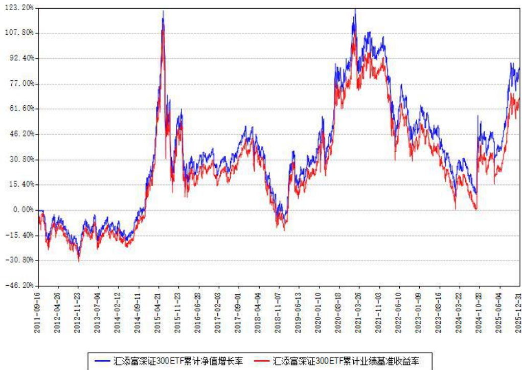
汇添富深证300ETF累计净值增长率与同期业绩基准收益率对比图

注：本基金建仓期为本《基金合同》生效之日（2011年09月16日）起3个月，建仓期结束时各项资产配置比例符合合同约定。