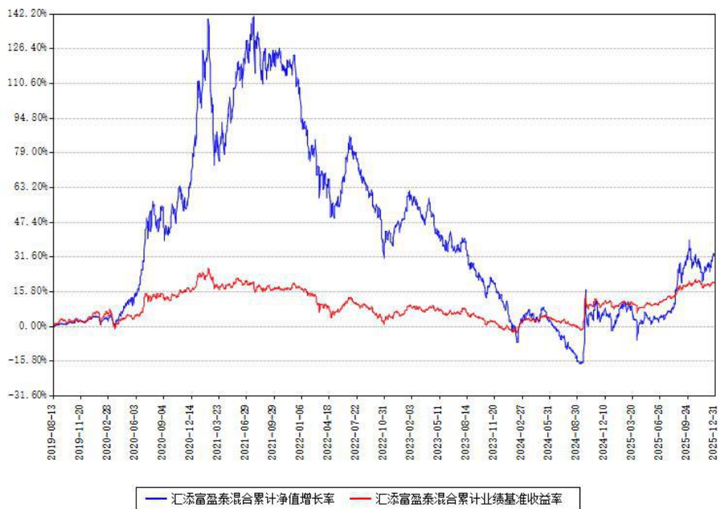
汇添富盈泰混合累计净值增长率与同期业绩基准收益率对比图

注：本基金建仓期为本《基金合同》生效之日（2019年08月13日）起6个月，建仓期结束时各项资产配置比例符合合同约定。