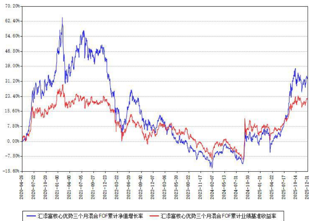
汇添富核心优势三个月混合FOF累计净值增长率与同期业绩基准收益率对比图

注：本基金建仓期为本《基金合同》生效之日（2020年04月26日）起6个月，建仓期结束时各项资产配置比例符合合同约定。