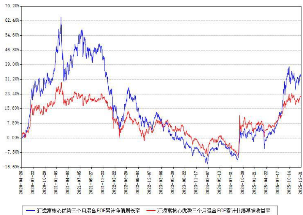
汇添富核心优势三个月混合FOF累计净值增长率与同期业绩基准收益率对比图