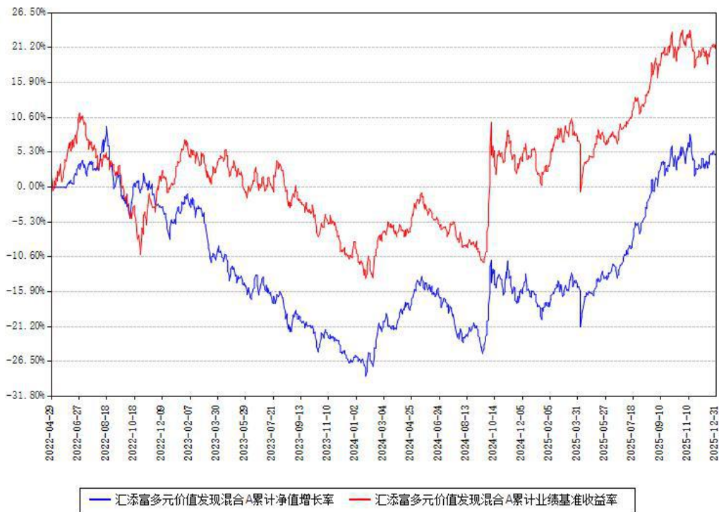
汇添富多元价值发现混合A累计净值增长率与同期业绩基准收益率对比图