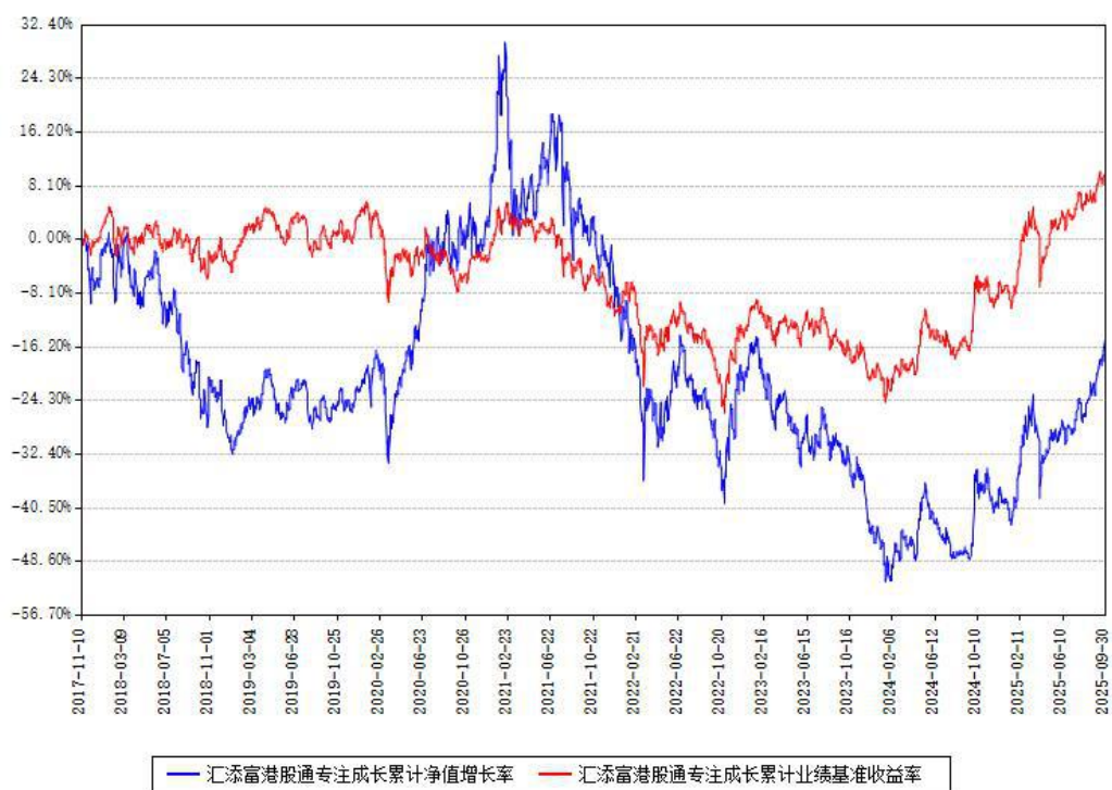
汇添富港股通专注成长累计净值增长率与同期业绩基准收益率对比图