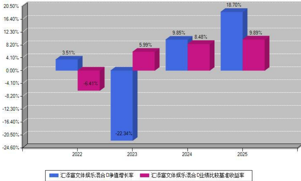
汇添富文体娱乐混合D每年净值增长率与同期业绩基准收益率对比图

注：数据截止日期为2025年12月31日，基金的过往业绩不代表未来表现。本《基金合同》生效之日为2018年06月21日，合同生效当年按实际存续期计算，不按整个自然年度进行折算。