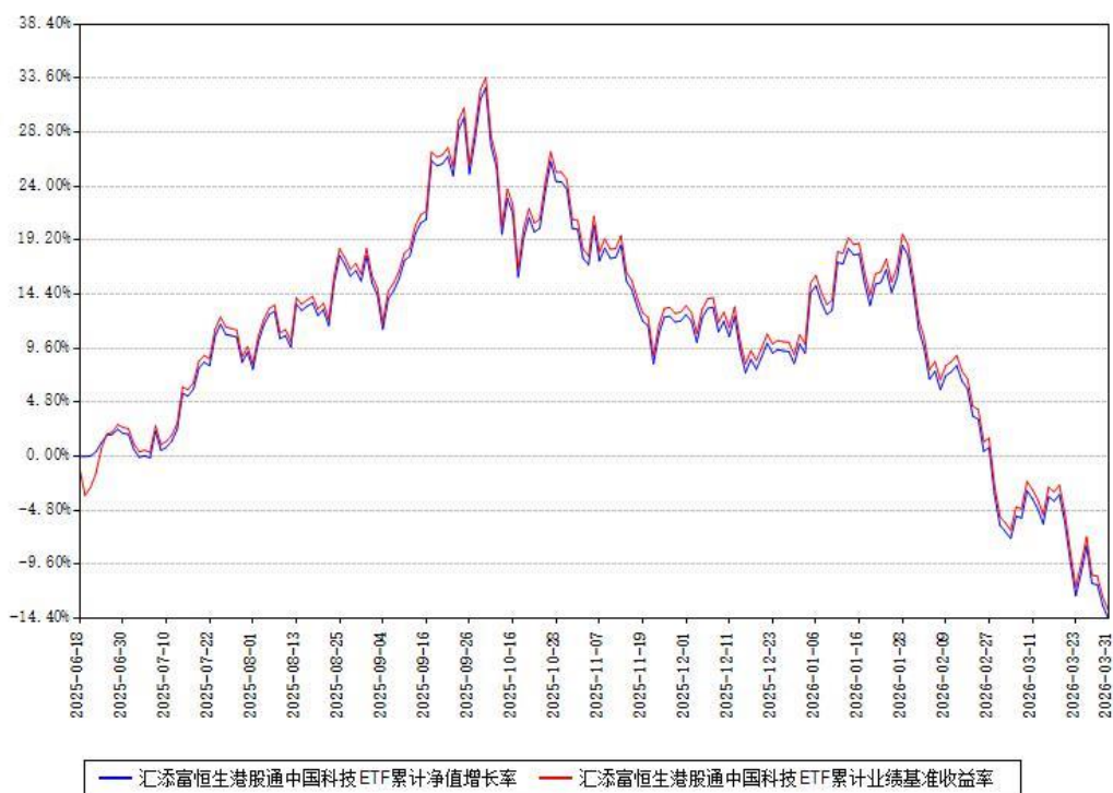
汇添富恒生港股通中国科技ETF累计净值增长率与同期业绩基准收益率对比图

(二) 自基金合同生效以来基金累计净值增长率变动及其与同期业绩比较基准收益率变动的比较图