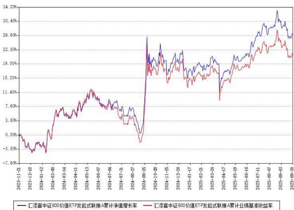
汇添富中证800价值ETF发起式联接A累计净值增长率与同期业绩基准收益率对比图

（二）自基金合同生效以来基金累计净值增长率变动及其与同期业绩比较基准收益率变动的比较图