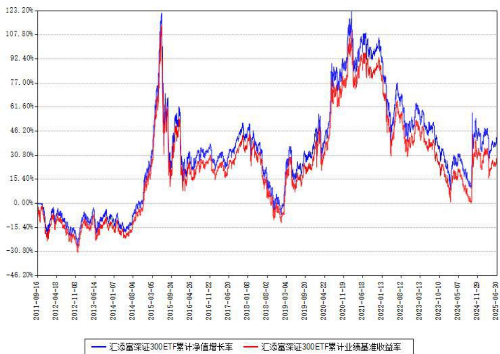
汇添富深证300ETF累计净值增长率与同期业绩基准收益率对比图