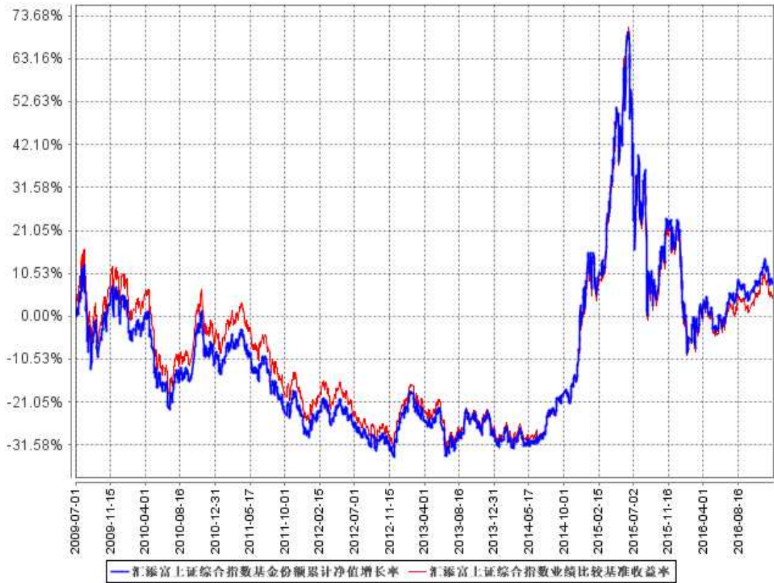
汇添富上证综合指数基金份额累计净值增长率与同期业绩比较基准收益率的历史走势对比图

注：本基金建仓期为本《基金合同》生效之日（2009年7月1日）起3个月，建仓期结束时各项资产配置比例符合合同规定。