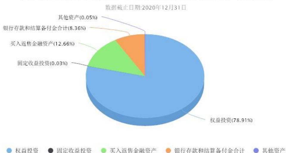
汇添富开放视野中国优势六个月持有股票C投资组合资产配置图表