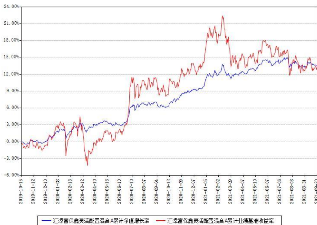
汇添富保鑫灵活配置混合A累计净值增长率与同期业绩基准收益率对比图