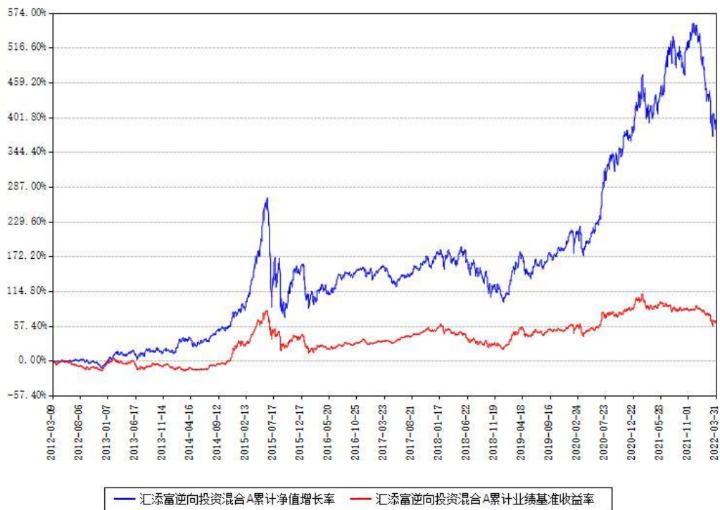
汇添富逆向投资混合A累计净值增长率与同期业绩比较基准收益率对比图