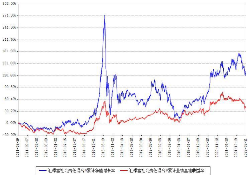
汇添富社会责任混合A累计净值增长率与同期业绩基准收益率对比图