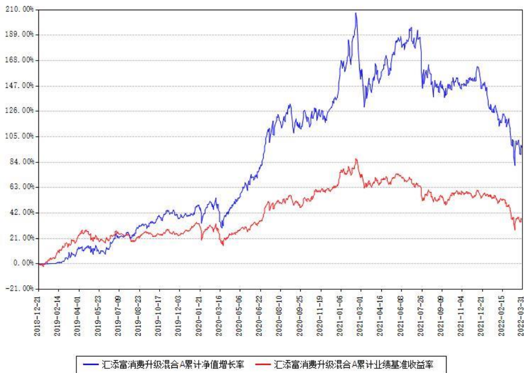
汇添富消费升级混合A累计净值增长率与同期业绩基准收益率对比图