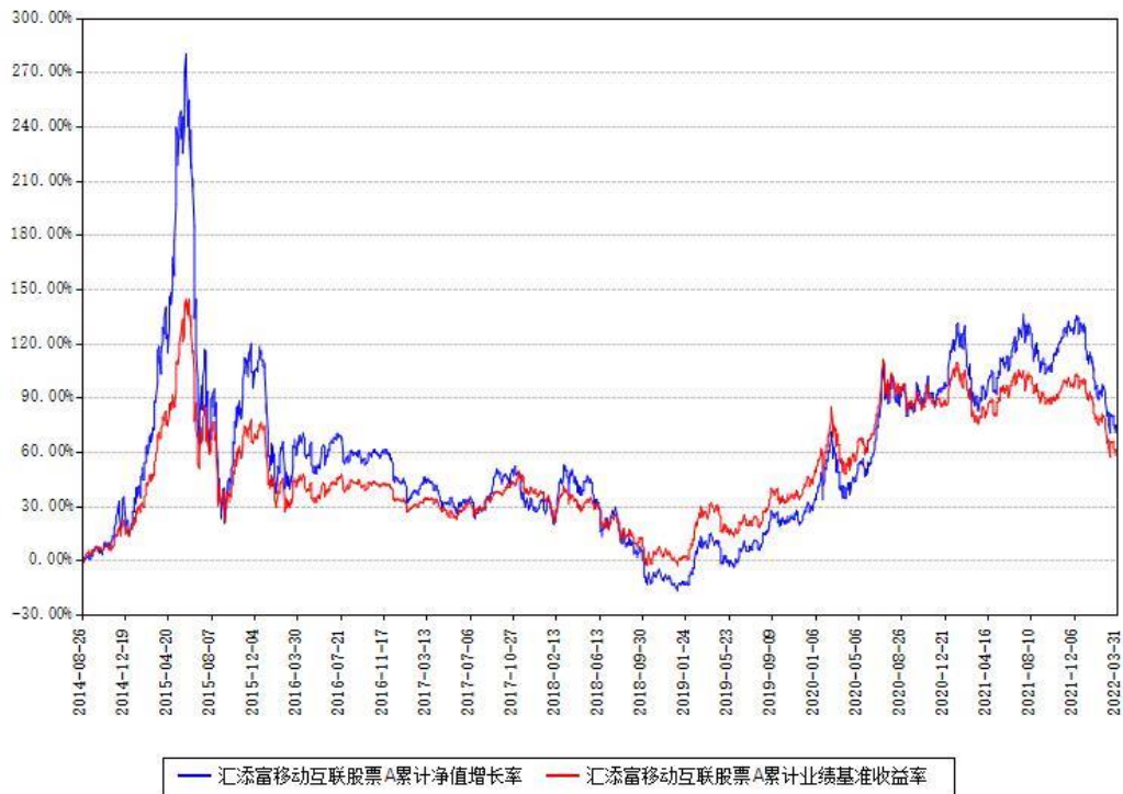
汇添富移动互联股票A累计净值增长率与同期业绩基准收益率对比图