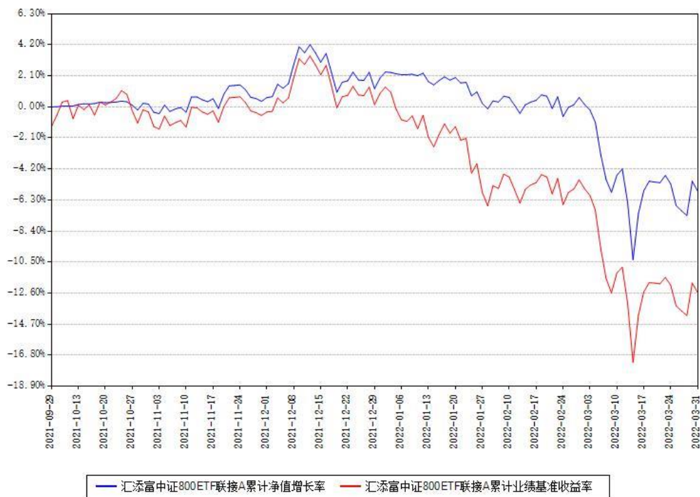
汇添富中证800ETF联接A累计净值增长率与同期业绩基准收益率对比图