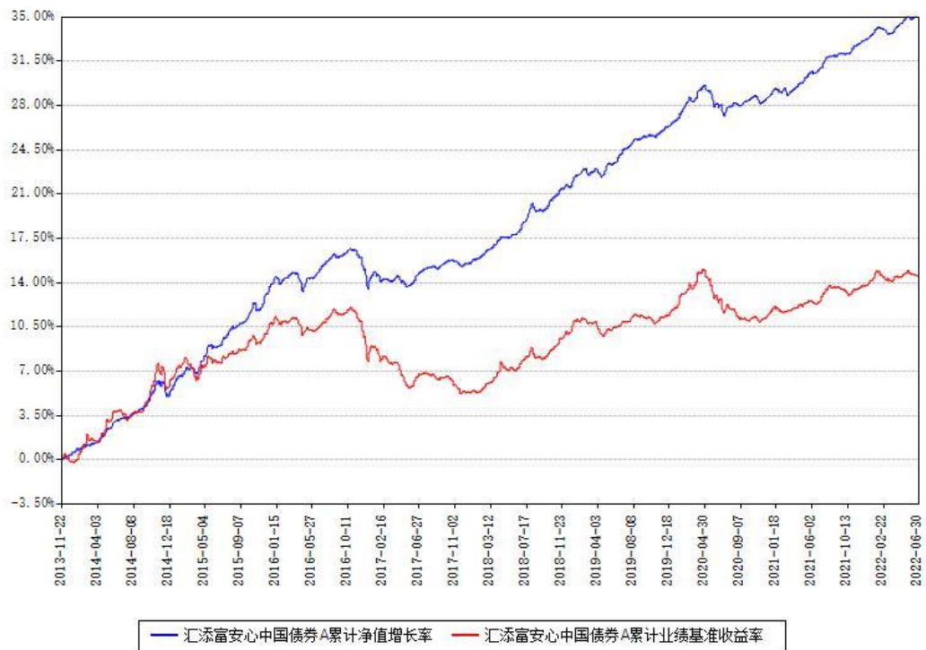
汇添富安心中国债券A累计净值增长率与同期业绩比较基准收益率对比图