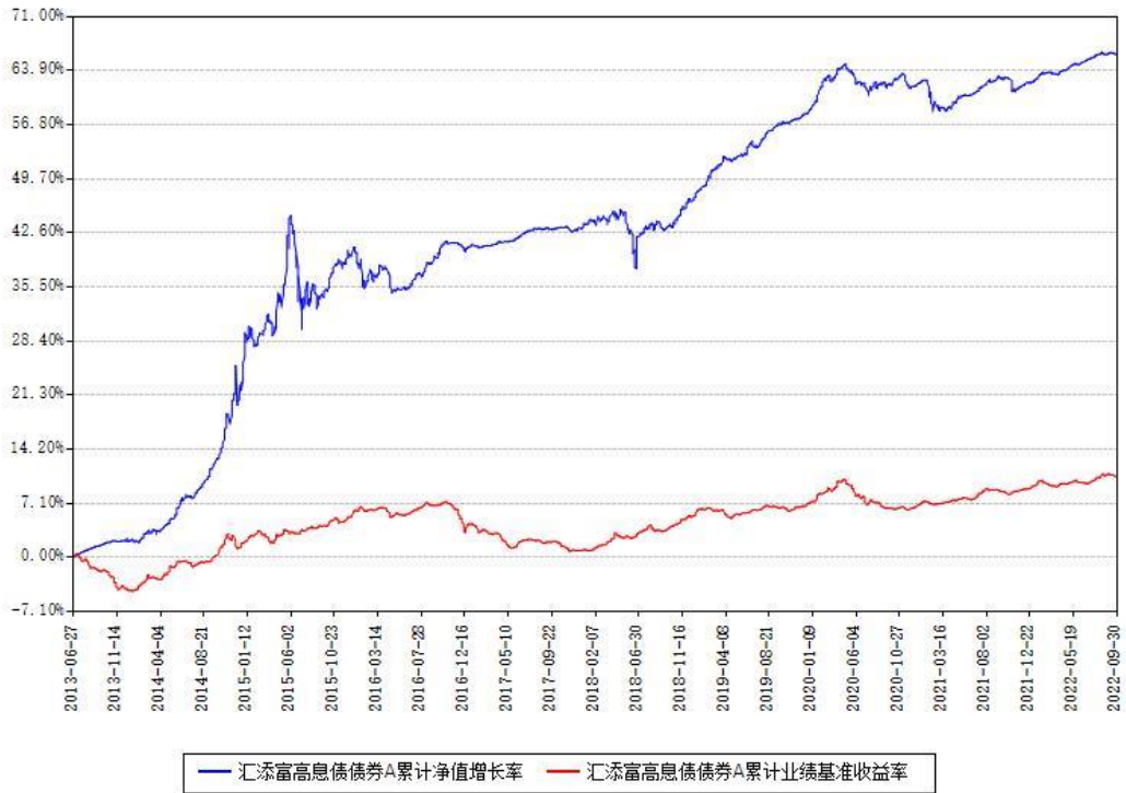
汇添富高息债债券A累计净值增长率与同期业绩基准收益率对比图