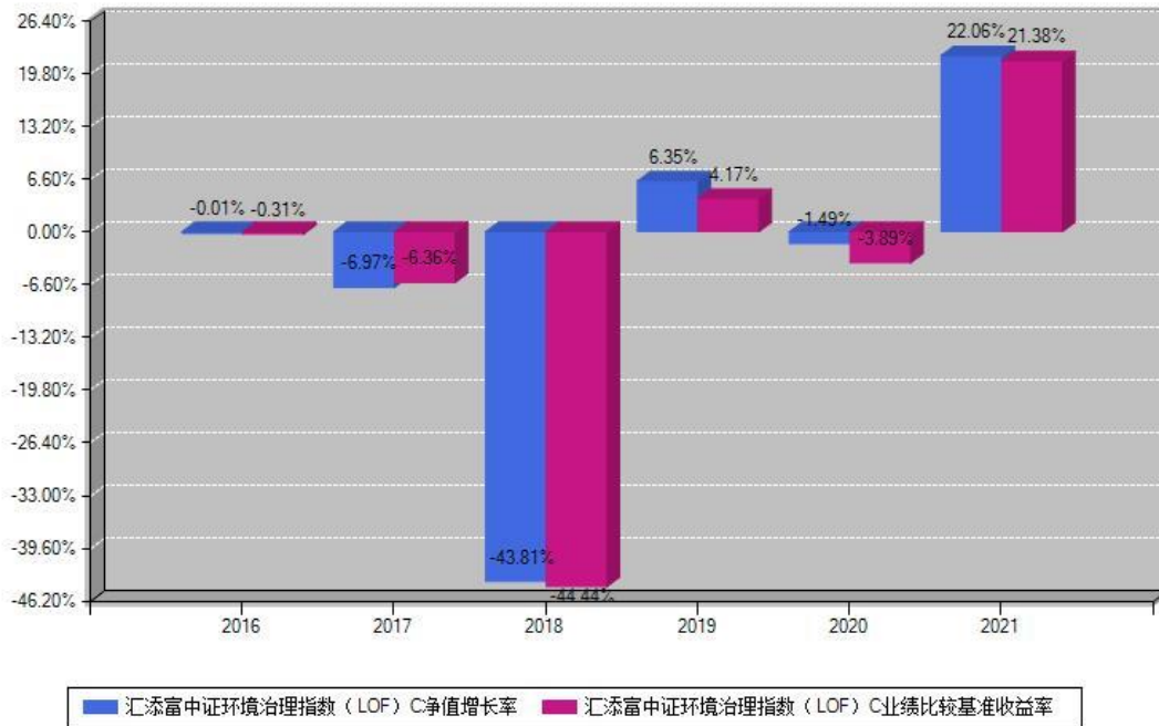
汇添富中证环境治理指数（LOF）C每年净值增长率与同期业绩基准收益率对比图

注：基金的过往业绩不代表未来表现。本《基金合同》生效之日为2016年12月29日，合同生效当年按实际存续期计算，不按整个自然年度进行折算。