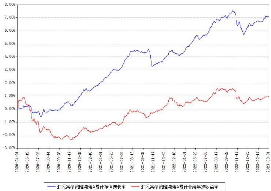
汇添富多策略纯债A累计净值增长率与同期业绩基准收益率对比图