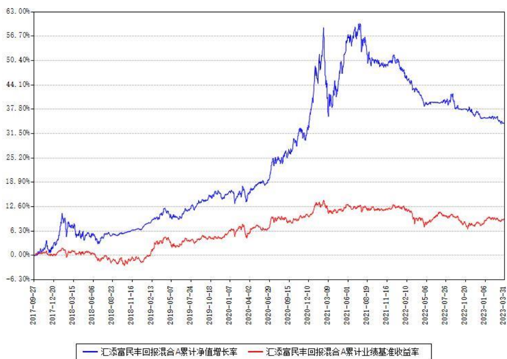
汇添富民丰回报混合A累计净值增长率与同期业绩比较基准收益率对比图