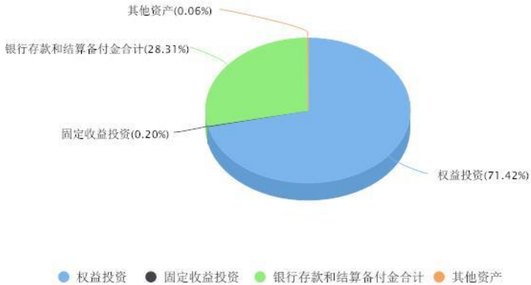
汇添富数字经济核心产业一年持有期混合A投资组合资产配置图表 数据截止日期:2023年03月31日