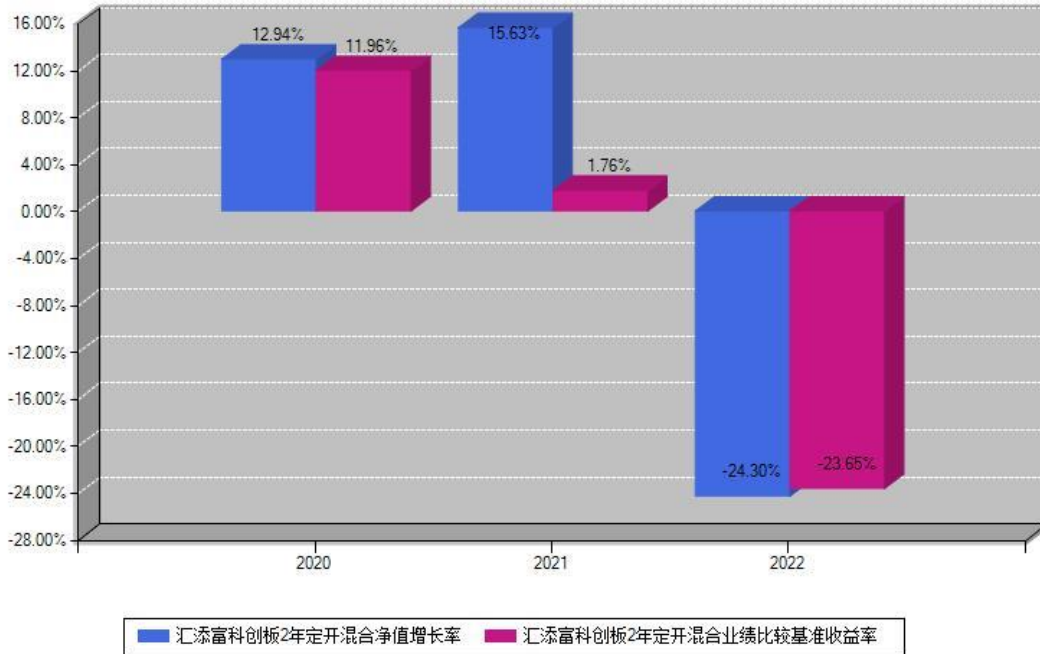
汇添富科创板2年定开混合每年净值增长率与同期业绩基准收益率对比图

注：基金的过往业绩不代表未来表现。本《基金合同》生效之日为2020年07月28日，合同生效当年按实际存续期计算，不按整个自然年度进行折算。