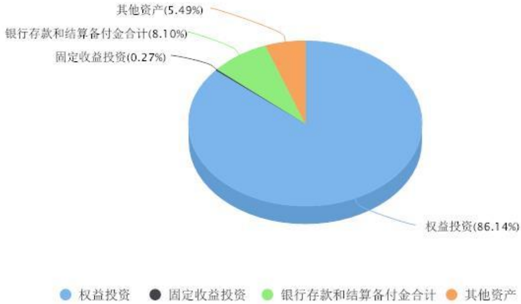
汇添富数字经济核心产业一年持有期混合A投资组合资产配置图表 数据截止日期:2023年06月30日