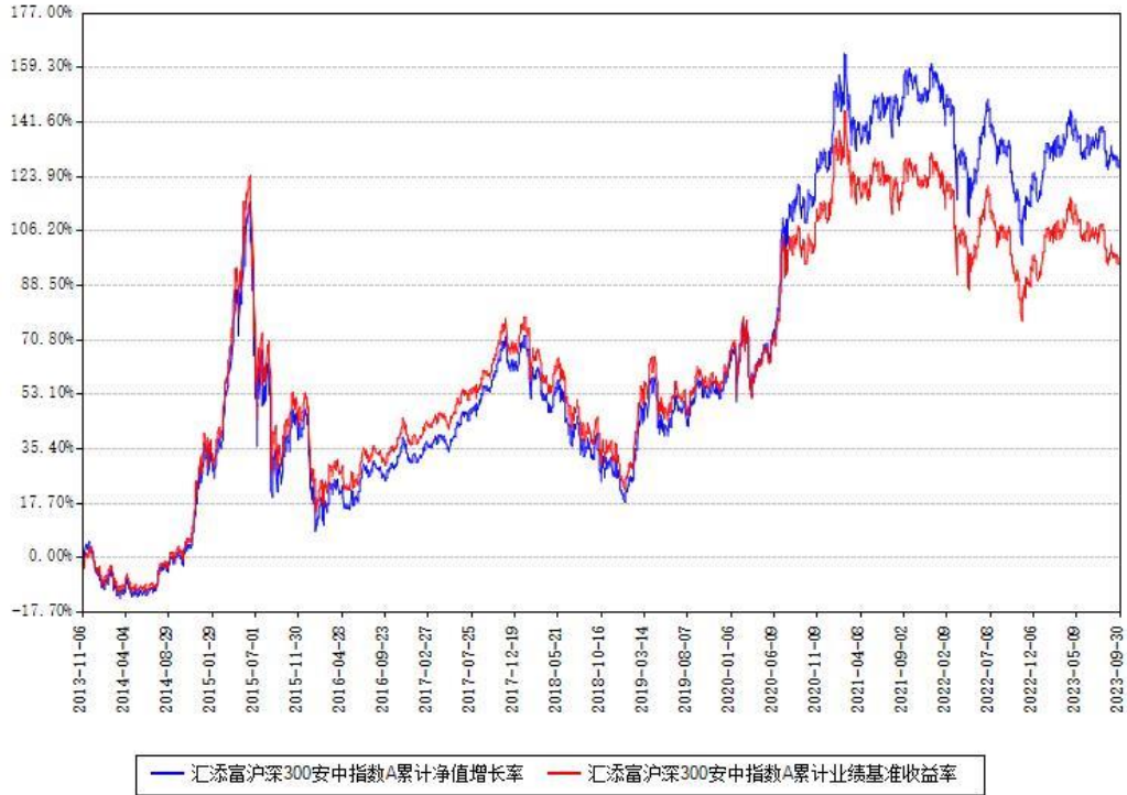
汇添富沪深300安中指数A累计净值增长率与同期业绩基准收益率对比图