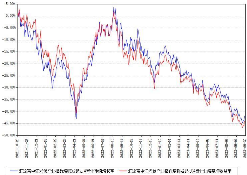
汇添富中证光伏产业指数增强发起式A累计净值增长率与同期业绩比较基准收益率对比图