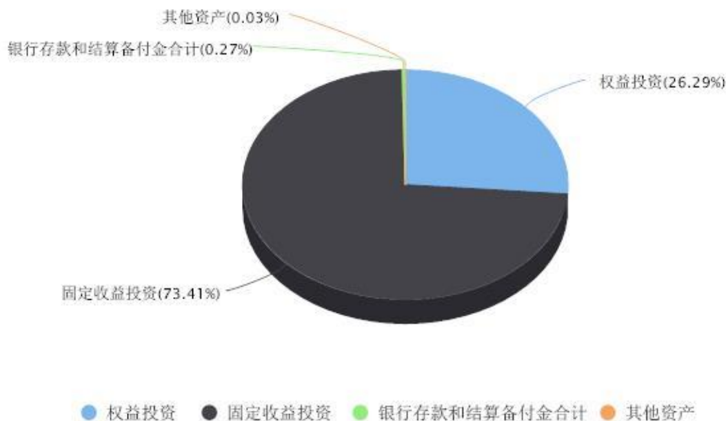
投资组合资产配置图表 数据截止日期:2022年12月31日