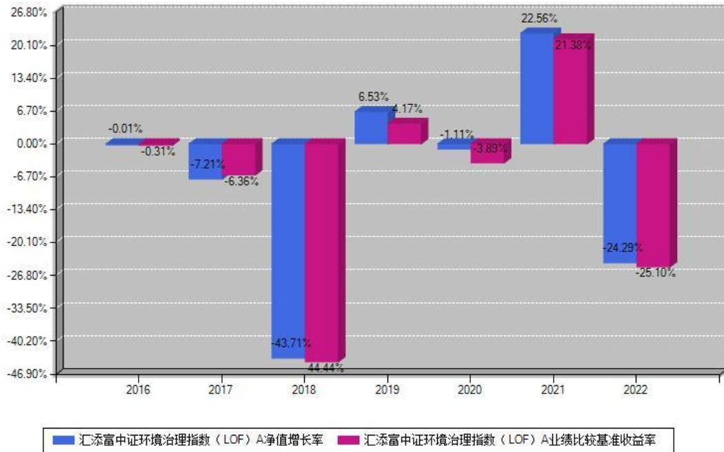
汇添富中证环境治理指数 (LOF) A 每年净值增长率与同期业绩基准收益率对比图

注：基金的过往业绩不代表未来表现。本《基金合同》生效之日为2016年12月29日，合同生效当年按实际存续期计算，不按整个自然年度进行折算。