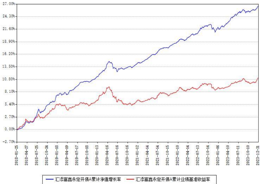
汇添富鑫永定开债A累计净值增长率与同期业绩比较基准收益率对比图