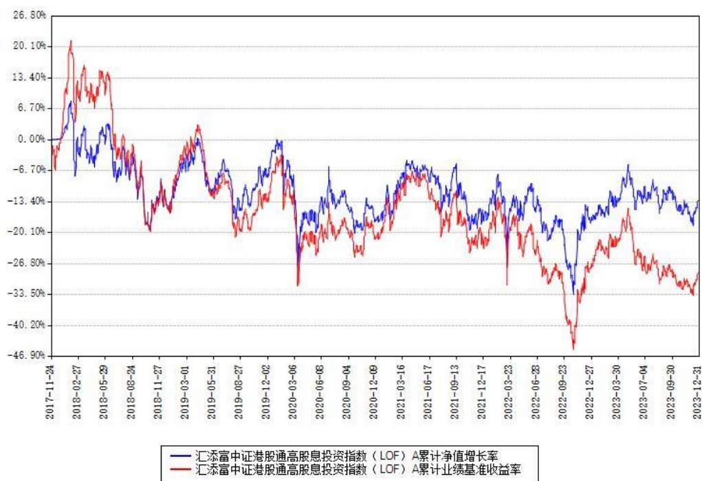
汇添富中证港股通高股息投资指数（LOF）A 累计净值增长率与同期业绩比较基准收益率对比图