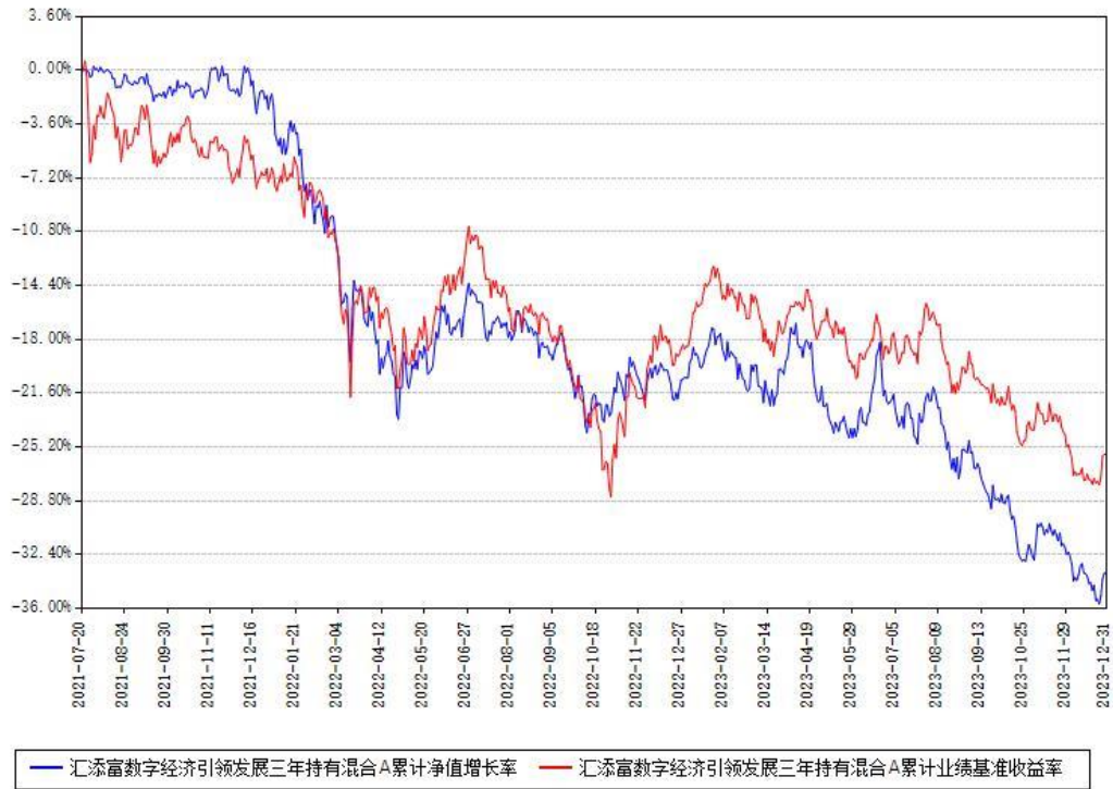
汇添富数字经济引领发展三年持有混合A累计净值增长率与同期业绩基准收益率对比图