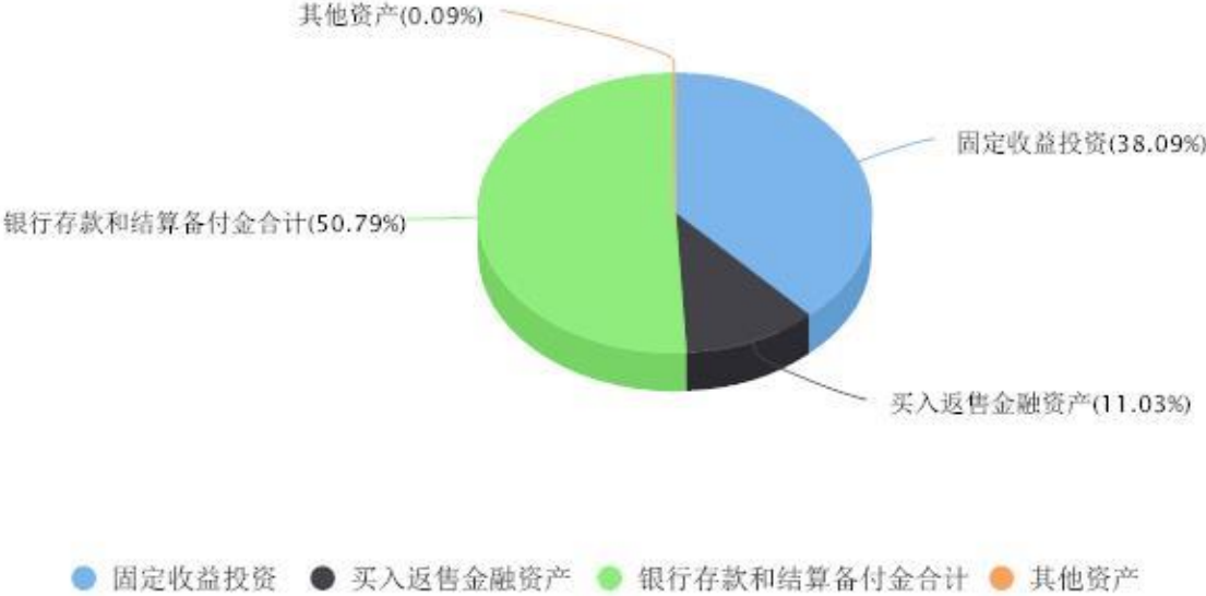
投资组合资产配置图表 数据截止日期:2023年12月31日