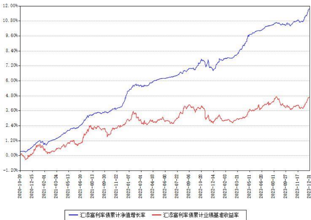
汇添富利率债累计净值增长率与同期业绩基准收益率对比图

注：本基金建仓期为本《基金合同》生效之日（2020年10月30日）起6个月，建仓期结束时各项资产配置比例符合合同约定。