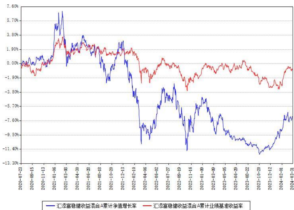
汇添富稳健收益混合A累计净值增长率与同期业绩比较基准收益率对比图