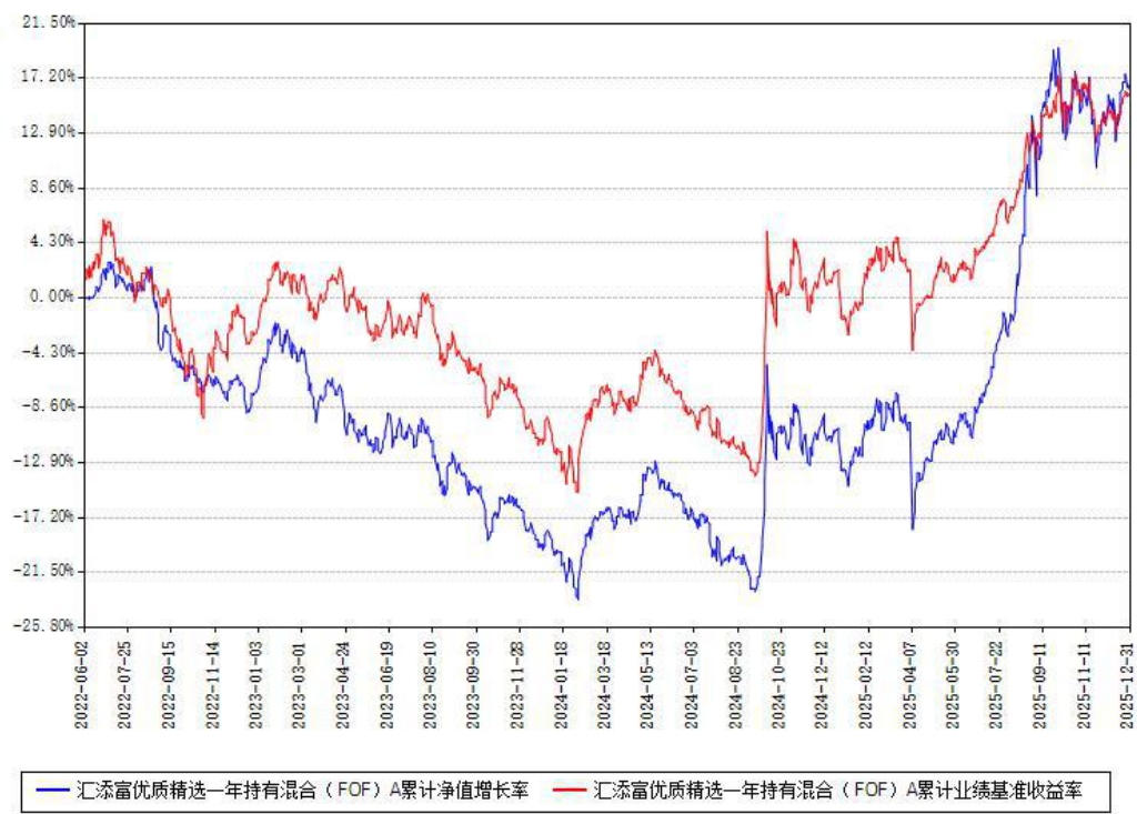
汇添富优质精选一年持有混合（FOF）A累计净值增长率与同期业绩基准收益率对比图