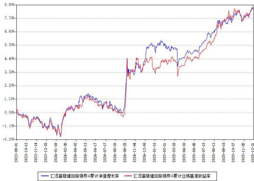
汇添富稳健回报债券A累计净值增长率与同期业绩基准收益率对比图