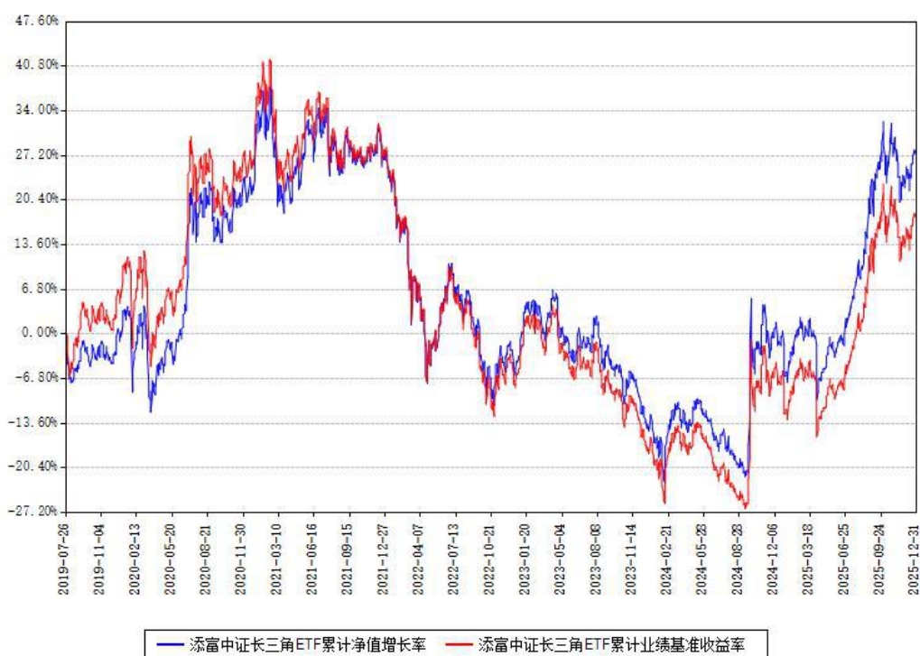
添富中证长三角ETF累计净值增长率与同期业绩比较基准收益率对比图

注：本基金建仓期为本《基金合同》生效之日（2019年07月26日）起6个月，建仓期结束时各项资产配置比例符合合同约定。