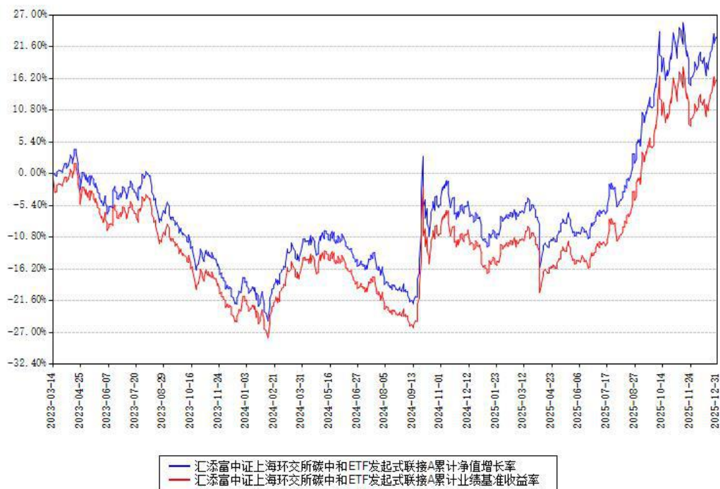
汇添富中证上海环交所碳中和ETF发起式联接A累计净值增长率与同期业绩基准收益率对比图