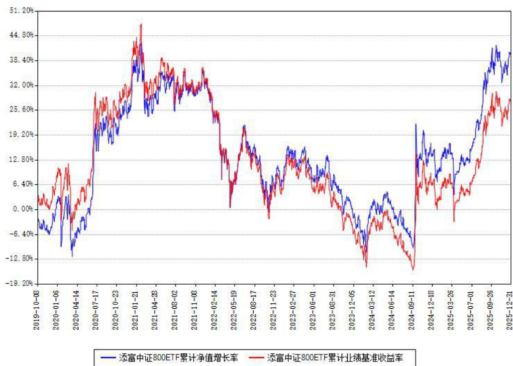
添富中证800ETF累计净值增长率与同期业绩基准收益率对比图

注：本基金建仓期为本《基金合同》生效之日（2019年10月08日）起6个月，建仓期结束时各项资产配置比例符合合同约定。