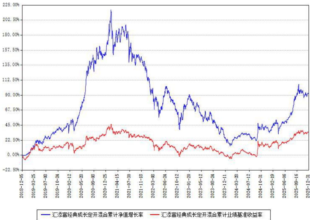
汇添富经典成长定开混合累计净值增长率与同期业绩基准收益率对比图

注：本基金建仓期为本《基金合同》生效之日（2018年12月05日）起6个月，建仓期结束时各项资产配置比例符合合同约定。