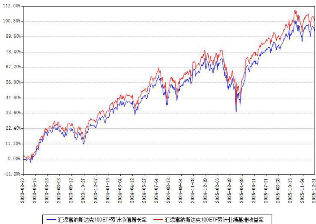
汇添富纳斯达克100ETF累计净值增长率与同期业绩基准收益率对比图

注：本基金建仓期为本《基金合同》生效之日（2023年03月30日）起6个月，建仓期结