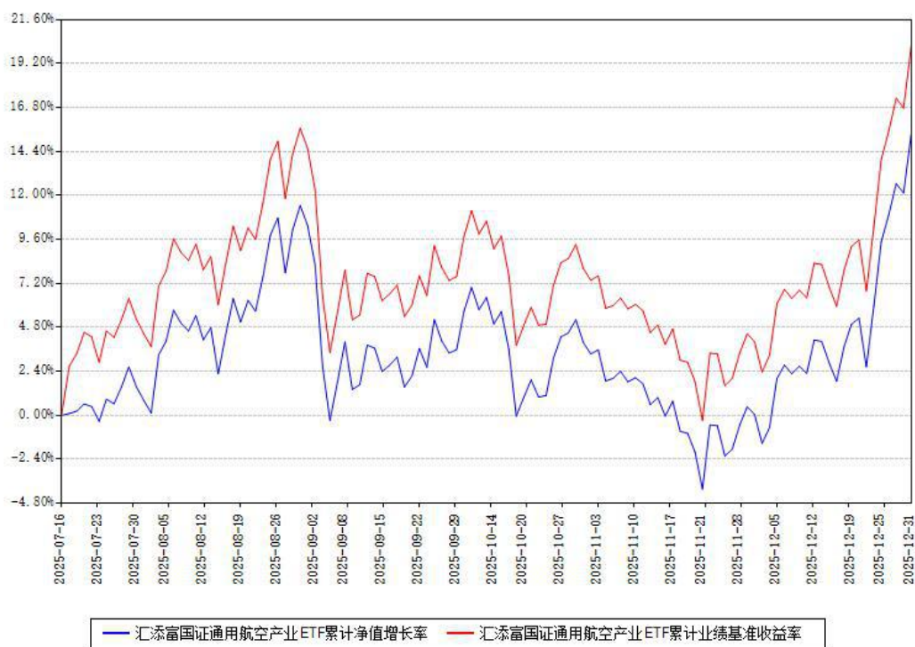
汇添富国证通用航空产业ETF累计净值增长率与同期业绩基准收益率对比图

注：本《基金合同》生效之日为 2025 年 07 月 16 日，截至本报告期末，基金成立未满一年。本基金建仓期为本《基金合同》生效之日起 6 个月，截至本报告期末，本基金尚处于建仓期中。